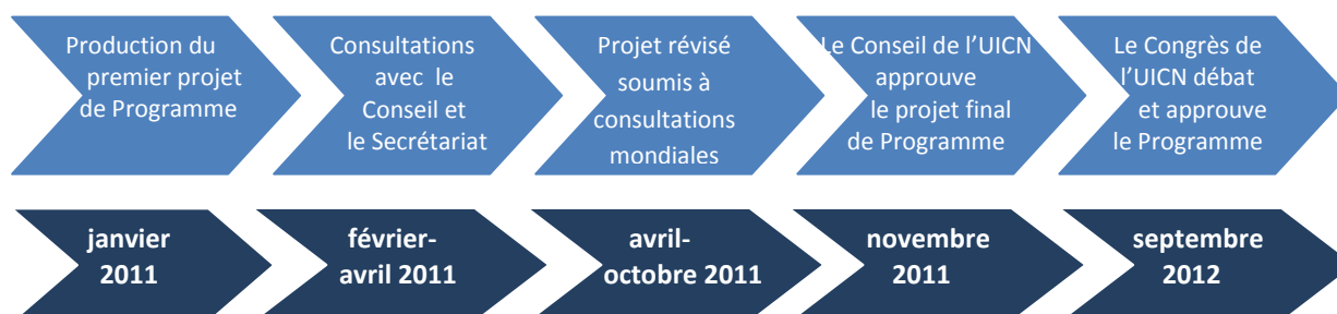
Figure 1: Programme de l'UICN 2013-2016, Calendrier de développement

Pendant les prochains six mois, les consultations sur le projet de Programme seront possibles via le Portail des Membres de l'UICN, les Forums régionaux de la nature en 2011, ainsi qu'au travers des réseaux de l'UICN. Ces consultations aboutiront à un projet final de Programme 2013-2016 qui sera examiné lors du Congrès mondial de la nature en 2012, pendant lequel les Membres de l'UICN pourront débattre et finalement approuver le document.